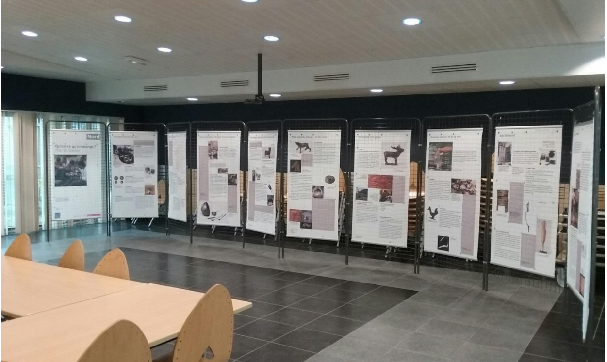
Prêt d'une exposition au collège de Pecquencourt

Les expositions sont prêtées gracieusement aux collèges du département qui en font la demande. En dehors des périodes scolaires, elles sont disponibles pour d'autres prêts : médiathèques, musées ... Ces expositions intéressent particulièrement les enseignants en lettres, en histoire et les documentalistes. Des questionnaires sont envoyés en amont par mail afin d'aider les enseignants à effectuer librement leurs visites.