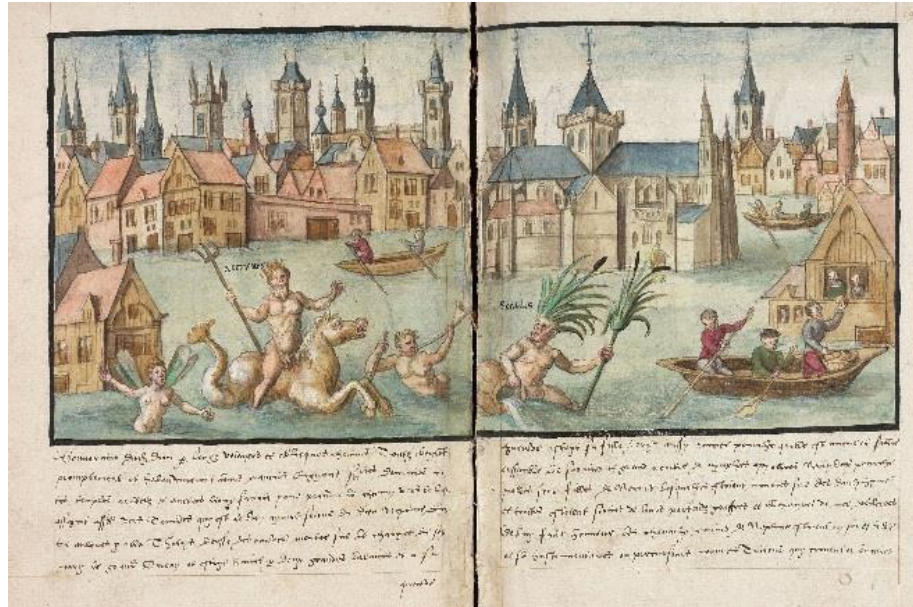
Douai, Bibliothèque municipale, ms 1183, t. III, f. 190v-191